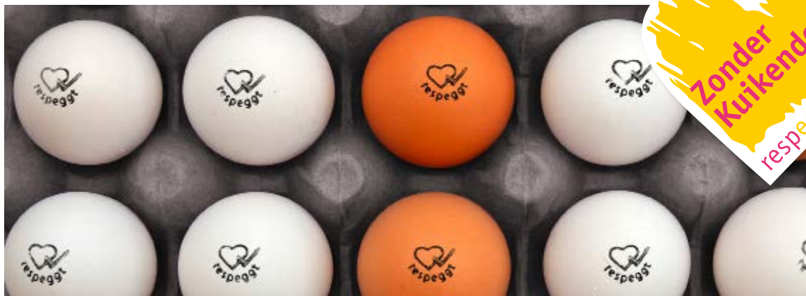
Afb. 2: respeggt-stempel en hartvormige respeggt-keurmerk