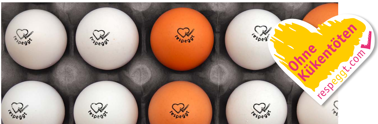
Abb. 2: respeggt-Stempel und respeggt-Herzsiegel